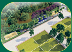
PREMIUM RESIDENTIAL PLOTS

900 sq.ft | 1250 sq.ft | 1500 sq.ft 1800sq.ft | 2000sq.ft | 2250 sq.ft