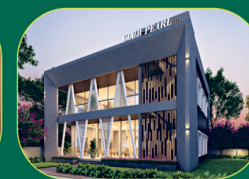
PREMIUM CLUB HOUSE