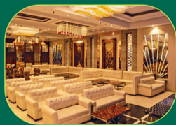
PREMIUM BANQUET HALL